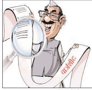
पाट दिया था। अब नतीजे आने के बाद चुनाव हारने वाले प्रत्याशी घर बैठ गए हैं। इससे काम नहीं चलेगा और चुनाव के दौरान खर्च हुई राशि को साझा करना पड़ेगा। जिला निर्वाचन विभाग ने 11 जनवरी तक खर्च की जानकारी देने का आखिरी तिथि निर्धारित किया है।

रायगढ़। विधानसभा चुनाव में प्रत्याशियों को एक निश्चित राशि खर्च करने की अनुमति निर्वाचन आयोग से मिला था। किए गए खर्च का हिसाब-किताब अगले महीने के 11 तारीख हर हाल में देना है। ऐसा नहीं करने पर कानूनी कार्रवाई भी हो सकती है। तय समय में खर्च की जानकारी नहीं देने पर जिला निर्वाचन विभाग चुनाव आयोग के शीर्ष अधिकारियों को जानकारी भेज देगा। इसके बाद आयोग तय करेगा कि उनके साथ क्या करना है। दोबारा मौका या फिर कार्रवाई होगी यह आयोग के ऊपर है।