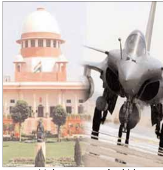
नई दिल्ली (आरएनएस)। सुप्रीम कोर्ट ने आज

शुक्रवार को राफेल लड़ाकू विमान खरीद प्रक्रिया की वैधता की जांच संबंधी व्याख्याओं को खारिज कर दिया। सुप्रीम कोर्ट के मुख्य न्यायाधीश रंजन गोगोई की अध्यक्षता वाली खंडपीठ ने संबंधित सभी जनहित याचिकाएं खारिज करते हुए कहा कि राफेल लड़ाकू विमान की खरीद की प्रक्रिया पर संदेह करने का कोई कारण नहीं बनता।