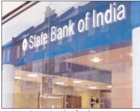
नई दिल्ली। भारतीय स्टेट बैंक ने अपनी कर्ज दरों में 0.05 फीसदी

अपने ग्राहकों को झटका दिया है। एसबीआई प्रबंधन ने ऋण पर ब्याज दर बढ़ाने की मंजूरी दे दी है। इस मंजूरी के बाद एसबीआई के होम या फिर कार लोन महंगे हो जाएंगे। दरअसल, बैंक ने नई दिल्ली। भारतीय स्टेट बैंक ने अपनी कर्ज दरों में 0.05 फीसदी की बढ़ोतरी कर दी है। यानी अब एसबीआई से कर्ज लेना महंगा हो जाएगा, साथ ही जो लोग पहले से लोन लिए हुए हैं, उनकी ईएमआई भी बढ़ जाएगी। ये दरें आज 10 दिसंबर, 2018 से प्रभावी हो गई हैं। एसबीआई ने सभी टेनर्स के लिए एमसीएलआर को 0.05 फीसदी बढ़ाया है। इस बढ़ोतरी के साथ अब एसबीआई की 1 साल की एमसीएलआर दर 8.5 से बढ़कर 8.55 फीसदी हो गई है।