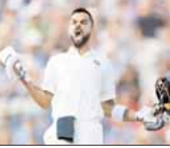
बाकी मैचों में से नौ में भारत को हार मिली, जबकि इतने ही मैच ड्रॉ हुए। अभी धोनी भारत के सबसे सफल कप्तान

टेस्ट मैच खेले हैं, जिनमें से 25 में उसने जीत दर्ज की है। हैं, जिनके नाम पर 60 मैचों में 27 जीत दर्ज हैं। मतलब कोहली को उनकी बराबरी करने के लिए अब केवल दो जीत की दरकार है। एंडिलेड टेस्ट जीतकर भारतीय टीम ने ऑस्ट्रेलिया के खिलाफ चार मैचों की सीरीज का शानदार आगाज किया है और ऐसे में उसके पहली बार ऑस्ट्रेलियाई सरजमीं पर सीरीज जीतने की संभावना भी बढ़ गई है।