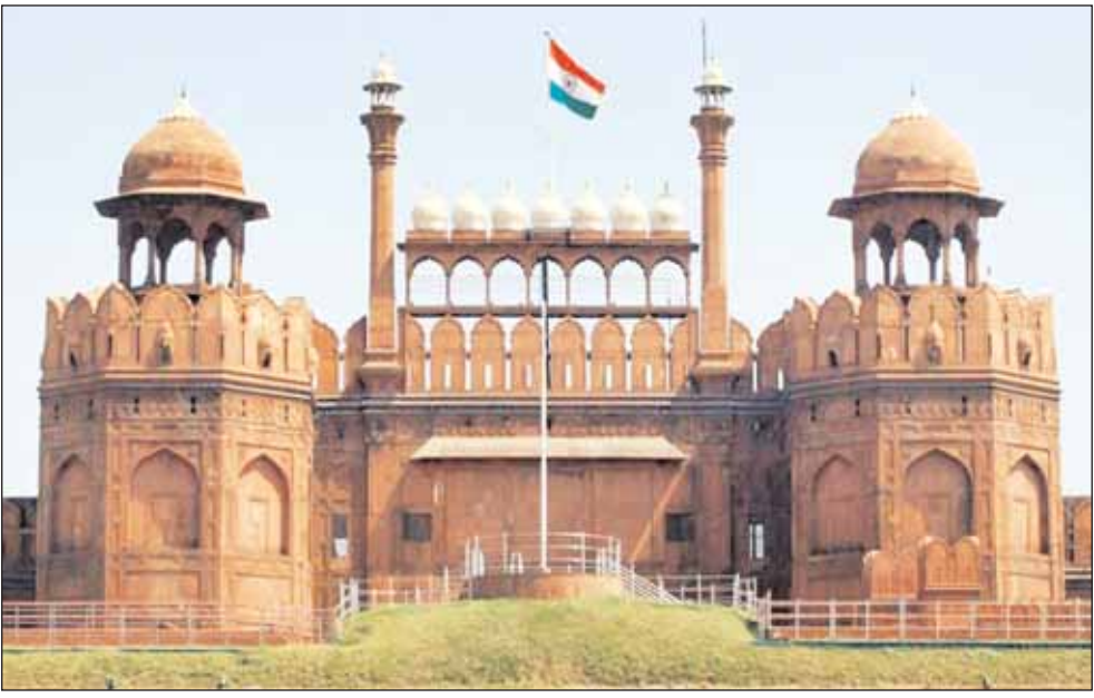
नई दिल्ली। नवजोत सिंह सिद्धू ने कहा -2019 में राहुल गांधी लाल किले पर झंडा फहराएंगे।