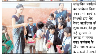
सांस्कृतिक कार्यक्रमों का आयोजन किया गया। सभी बच्चों को शिक्षकों द्वारा भेंट देकर बालदिवस की शुभकामनाएं देते हुए बड़े धूमधाम से उत्साह से मनाया गया। कार्यक्रम के बीच लायंस क्लब के सदस्यों ने अपनी उपस्थिति दी और उनके द्वारा भाषण स्कूल में आज दिनका 14 नवंबर को प्रतियोगिता, युवक सभा का आयोजन किया गया।