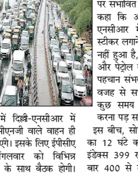
पेसे में दिल्ली-एनसीआर में सिर्फ सीएनजी वाले वाहन ही चल पाएंगे। इसके लिए ईपीएफ की मंगलवार को विभिन्न विभागों के साथ बैठक होगी।