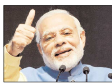
डॉक्टर महातिर को पद संभालने के लिए शुभकामनाएं दीं। मलयेशिया के प्रधानमंत्री के रूप में 92 वर्षीय